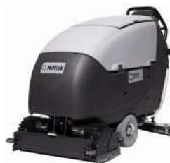
CHARIOT DE BIONETTOYAGE